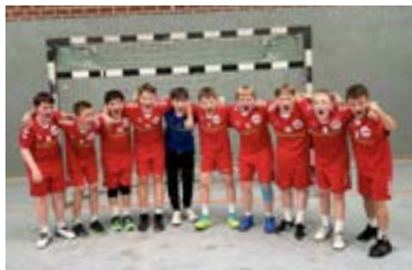
Meister in der Regionsoberliga!

schaft lebte. Zu Beginn der 2. Halbzeit spielten die Horneburger jedoch stark auf und konnten mit einigen Tempogegenstößen bis auf 17:14 verkürzen. Es waren nur noch 12 Minuten zu spielen, als Trainer Chris Wolf seine letzte Auszeit nahm. Nach dem Timeout holten die Jungs alles aus sich raus und kämpften gemeinsam für jedes Tor. Nach dem 19:15 in der 30. Minute erzielten die TS-Ver innerhalb von nur drei Minuten sechs Tore in Folge. Es wurde unfassbar spannend, alle guckten immer wieder auf die Uhr. Die Zeit rannte den Jungs davon. Aber genau sechs Sekunden vor dem Ende trafen die Jungs zum 30:18 und es gab kein Halten mehr. Die Jungs hatten es geschafft und waren Meister in der Regionsoberliga! Herzlichen Glückwunsch an die Jungs!