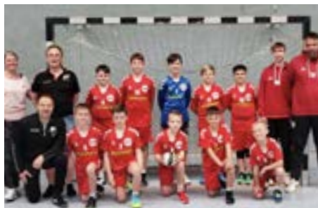
Ehrung der Meistermannschaft durch die Handballabteilung

Und abschließend vielen Dank an die Eltern, die immer dabei waren, egal ob bei Heimspielen oder bei weiten Auswärtsfahrten.