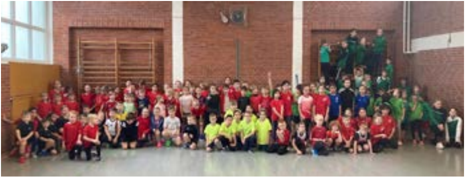
Gruppenfoto der teilnehmenden Mannschaften beim 31. Hallensportfest des TSV Altenwalde