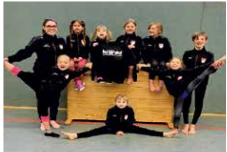
Gruppe am Kasten