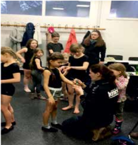
Großes Umziehen, Bemalen und Zöpfe noch mal richten

Wir nutzten jede Gelegenheit, um zu trainieren, für unseren ersten Wettkampf dieses Jahr und natürlich für die große Küstenturnshow, die wir bereits im letzten Beitrag erwähnt hatten.