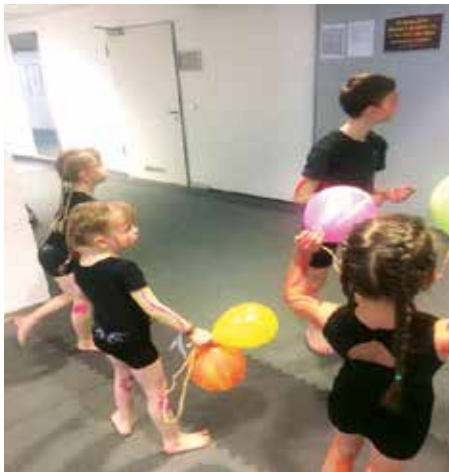
Warten auf dem Gang

Freude und Spaß bei den Vorbereitungen direkt vor der Show, beim Bemalen unseres Körpers, beim Haareflechten, beim Einturnen auf dem Gang.